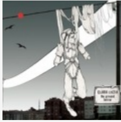
The Ground Below